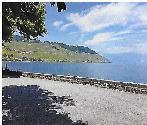
Le beau temps était au rendez-vous pendant cette journée.