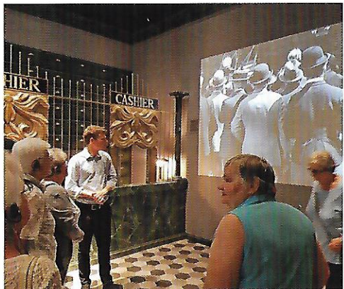
La visite guidée du Musée Charlie Chaplin à Corsier sur Vevey.